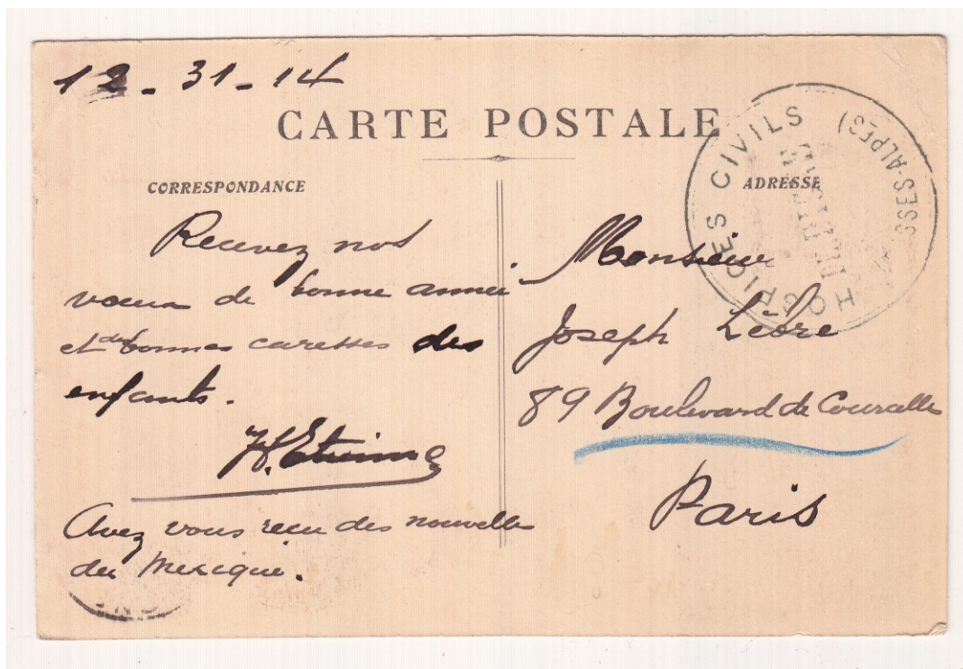
Carte-postale en franchise militaire, du 31 décembre 1914 - départ Digne-Les-Bains