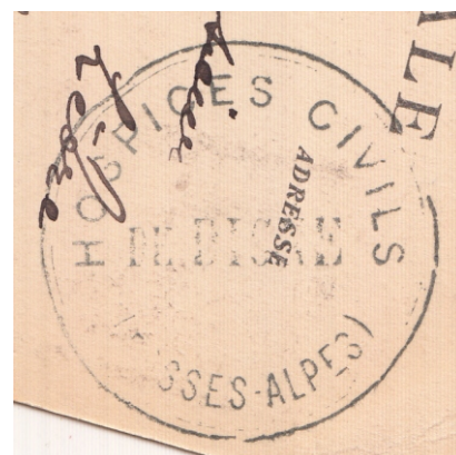
Echelle : 1,3 / 1