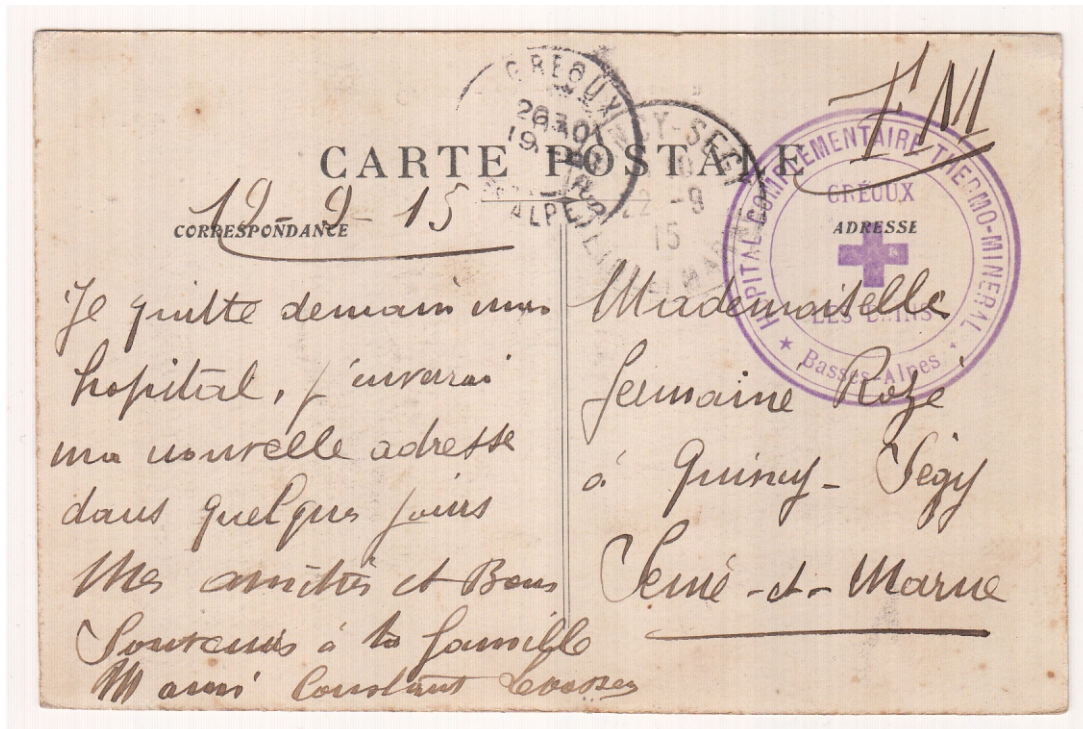
Carte-postale en franchise militaire, du 19 septembre 1915 - départ Gréoux-Les-Bains - cachet violet